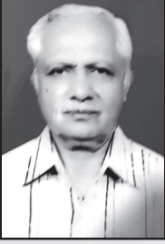
डॉ. जयनारायण मंत्री